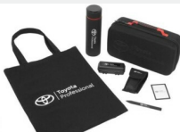
Zestaw prezentowy Professional Gadżety